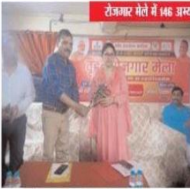
रोजगार मेले में 146 अभ्यर्थियों का चयन