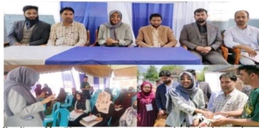
Bandipora May 21:

The Department of Employment and Career Counseling (DE&CC) Bandipora, in collaboration with leading employers Sunday organized day long Job Fair cum Placement drive.