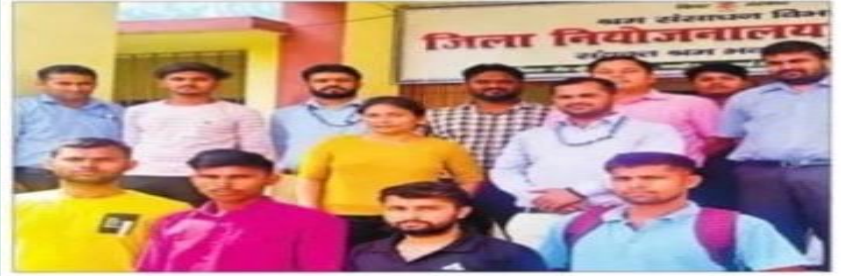
जॉब कैम्प में भाग लेते अभ्यर्थी। संवाददाता, बेगूसराय

जिला नियोजन-बलय द्वारा संयुक्त श्रम भवन आइटीआइ कैम्पस में एक दिवसीय जॉब कैम्प का आयोजन किया गया, जहां 100 कर्मियों के विस्तृत 44 अभ्यर्थियों का साक्षात्कार के उपरान्त स्थल पर ही नियुक्ति पत्र दिया गया, यह बातें जिला नियोजन पर्यवेक्षकरी केता वशिष्ठ ने कही।