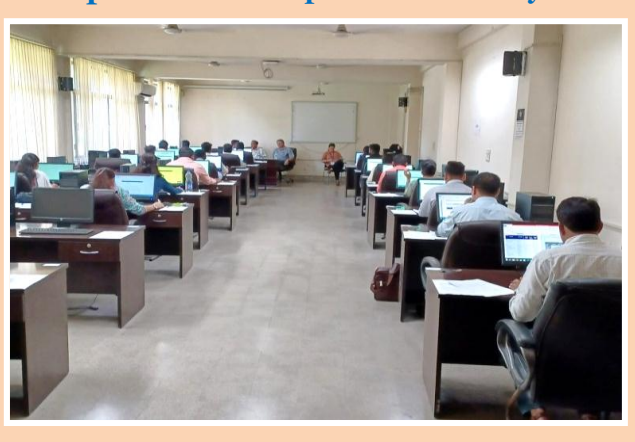
Glimpses from Interview Round