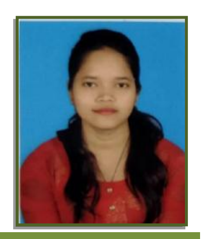
Ruma Mahato Saraikela, Jharkhand

"During my job search I came across a notification early in the month of July'22 about a Placement Drive being organized by Model Career Center, Chandil for the job role of PHP Developer. The venue of this Placement Drive was far from my place and also there was no certainty of getting that job, so I was confused if or not to attend this Placement Drive. But then somehow I planned to attend the Placement Drive and to my pleasant surprise the entire recruitment process went smooth and fast at MCC, Chandil. I finally got selected for the job position of PHP Developer with a decent salary.