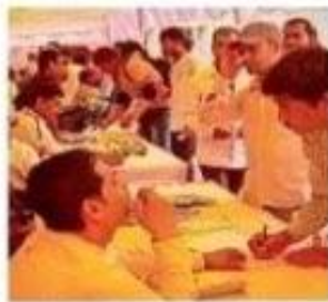
मार्गदर्शन मेला में आये लोग।

श्रम संसाधन विभाग से जिला नियोजनरतय द्वारा आयोजित जिला स्तरीय नियोजन सह मार्गदर्शन मेले में 1,253 आवेदकों में 564 युवाओं को रोजगार के लिए शॉर्टलिस्ट किया गया है। शॉर्टलिस्ट कि गए युवाओं को विभिन्न कंपनियों में रोजगार के अवसर मिलेंगे। बता दें कि शुक्रवार को जिला नियोजनरतय, कैमूर द्वारा एक दिवसीय नियोजन से व्यसर्वाधिक मार्गदर्शन मेले का आयोजन लिच्छवी