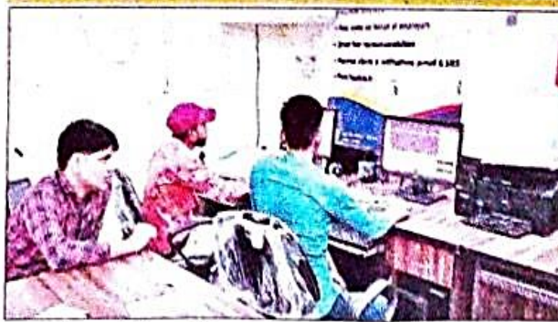
नेशनल कैरियर सर्विस कार्यालय में प्रशिक्षण लेते युवा। संवाद

भारत सरकार ने की नेशनल कैरियर सर्विस सेवा की शुरुआत | गत तीन माह में 1179 युवाओं के लिए दिया गया प्रशिक्षण