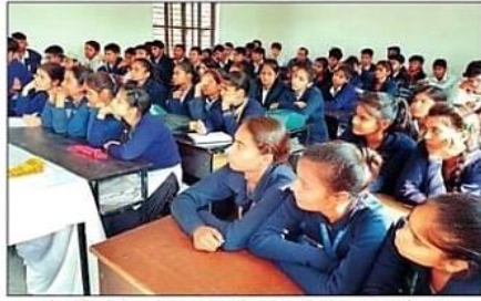
जैन चौरसिया इंटर कॉलेज में कार्यशाला में मौजूद छात्र-छात्राएं।