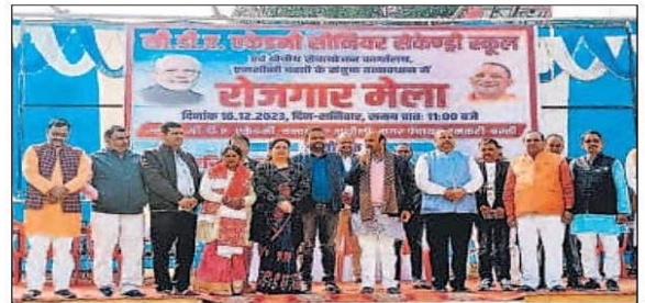
शनिवार को बनकटी में आयोजित रोजगार मेले में शामिल अतिथिगण।