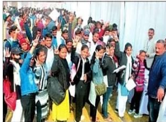
आगरा कॉलेज में आयोजित रोजगार मेले में नौकरी मिलने पर खुशी जताते युवा। अना