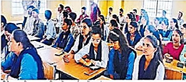
सौभाग्य से रोजगार प्रसिद्धि युवाओं को नौकरी ढूँढने के उद्देश्य से ऑनलाइन, आर्टिफिशियल इंटेलिजेंस और रोजगार मेला सहित नए तरीकों का उपयोग किया गया है।

सौभाग्य से रोजगार प्रसिद्धि युवाओं को नौकरी ढूँढने के उद्देश्य से ऑनलाइन, आर्टिफिशियल इंटेलिजेंस और रोजगार मेला सहित नए तरीकों का उपयोग किया गया है। निम्नलिखित कंपनियों का शामिल होना है। इनमें अपने-अपने संस्थान की जगह के अनुसार मेले में आने वाले युवाओं का साक्षात्कार लेते हैं और योग्य पाए जाने पर ऑफर लेटर देते हैं। रोजगार कार्यालय के अनुसार नए रोजगार मेला 2024-25 में ऑनलाइन से जुलाई के बीच 13 रोजगार मेले और ऑफर लेटर मिले हैं।