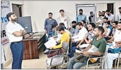
Youth attending a Job Fair organised by DECC in Ramban on Thursday.