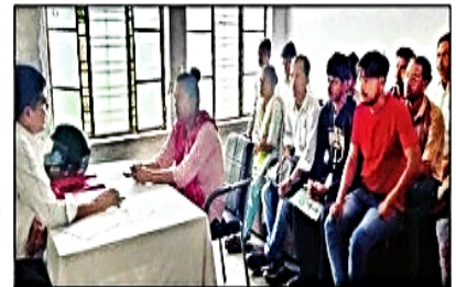
रोजगार मेला में साक्षात्कार लेते कंपनी के प्रतिनिधि। संवाद