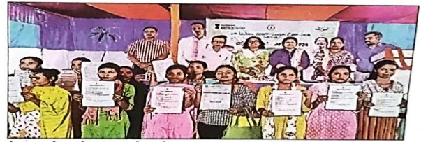
रोजगार मेला में ऑफर लेटर के साथ अभ्यर्थी साथ में अतिथि।