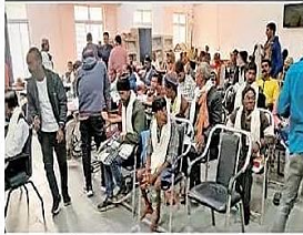
मार्गदर्शन शिविर में शामिल दित्यांगजन।