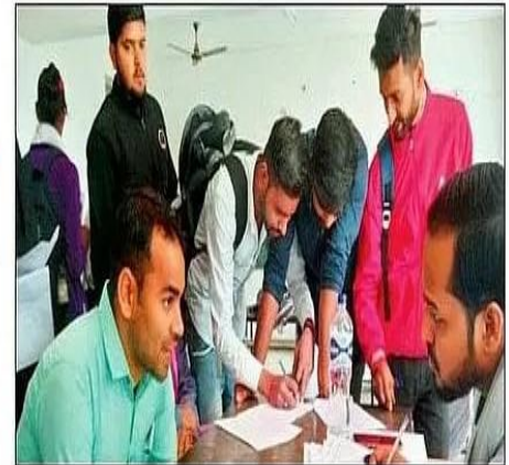
रोजगार मेले में प्रतिभाग करते युवा।