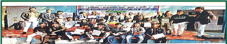
जनता इंटर कॉलेज धर्मपुर में नियुक्ति पत्र के साथ युवा।