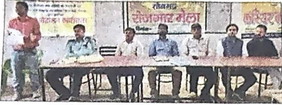
रोजगार मेले मौजूद लोग।

सोनभद्र। जिला सेवायोजन विभाग की तरफ से देवो महेश कॉलेज ऑफ इंजीनियरिंग एंड टेक्नोलॉजी सुकृत में बृहस्पतिवार को रोजगार मेले का आयोजन किया गया। इसमें 300 अभ्यर्थियों ने भाग लिया। 112 अभ्यर्थियों का चयन हुआ।