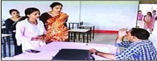
महाविद्यालय में आयोजित रोजगार मेले में अभ्यर्थियों का होता साक्षात्कार।