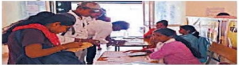
सीहोर, रोजगार मेले में पंजीयन कराते हुए।