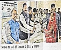
विजयन केसल में भूमिीनी को टैक गीतने अवसर • अजयबा