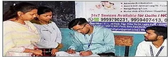
जिला सेवायोजन कार्यालय में आयोजित रोजगार मेला में साक्षात्कार लेते कंपनी के प्रतिनिधि। संवाद

मेले में पुखराज हेल्थकेयर प्राइवेट लिमिटेड, क्लिंकिट, युनिवर्सल जनरल इश्योरंस, केअर हेल्थ, एआईएम, बजाज कैपिटल, केबिन केअर जैसी 12 कंपनियों ने प्रतिभाग किया और अभ्यर्थियों को उनकी योग्यता के आधार पर चयन किया। मेले में 300 युवाओं ने