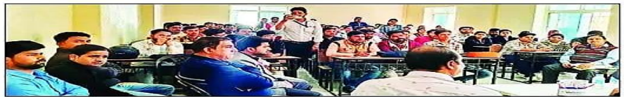
अभ्यर्थियों को तनाव प्रबंधन की विधि समझाते काउंसलर।