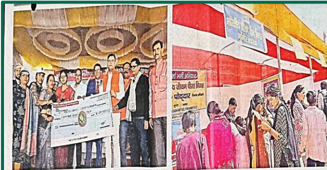
लक्ष्मीदेवी को टैक गीतने अवसर • अजयबा